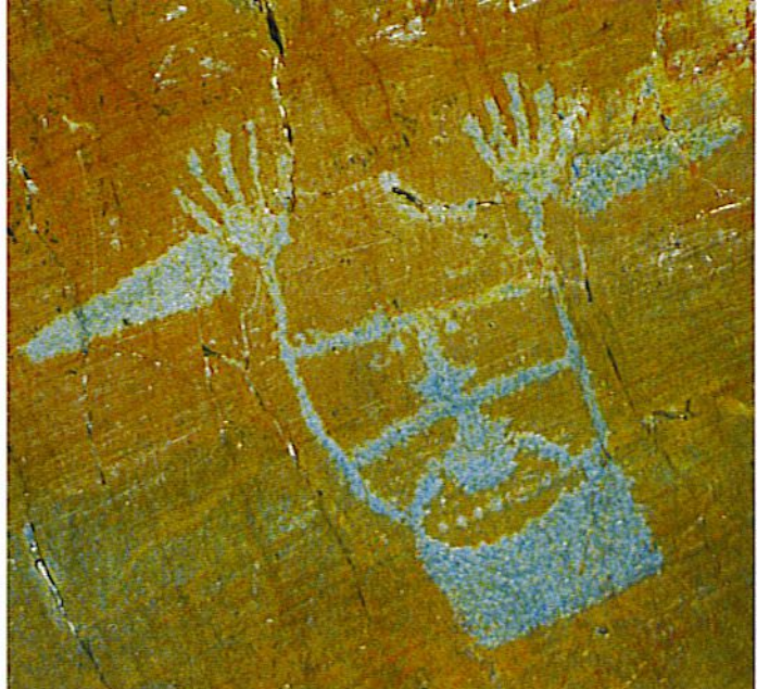
L'énigme du sorcier : cette figure menaçante a donné lieu à de nombreuses interprétations. S'agit-il d'appeler la pluie, d'éloigner les rôdeurs des enclos du bétail ou même d'exorciser la peur des dieux ?

Il s'agit bien d'une montagne sacrée, témoin de la naissance d'un culte complexe et la naissance de l'esprit religieux en l'homme confronté à la prise de conscience de sa fragilité face aux éléments et aux mystères de la nature.